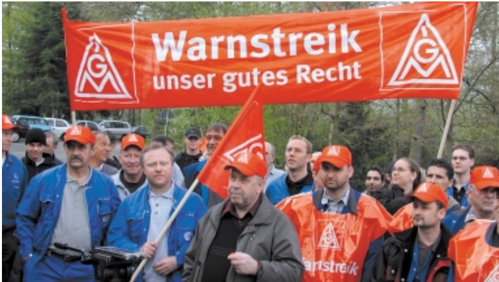
Warnstreik zur Verhandlung am 20. April 2004: Arbeitgeber brauchen wieder Druck