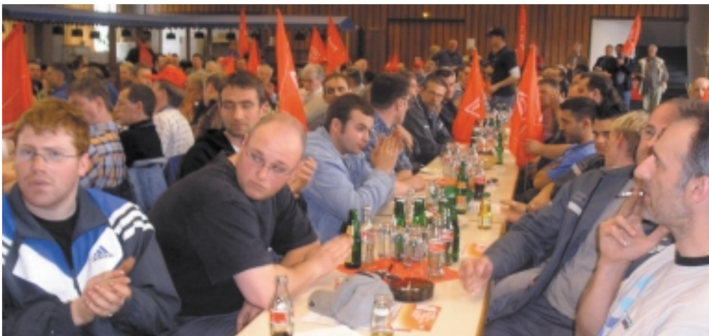
Kfz-Handwerker in Aktion am 28. April: Protest hat gewirkt

In den Autohäusern der Dechent-Gruppe wird wieder 36,5 Stunden pro Woche gearbeitet. Die tarifwidrige Arbeitszeitverlängerung ist vom Tisch. Über einen Ausgleich für die bisherige unbezahlte Mehrarbeit wird verhandelt. Was war geschehen? Die Beschäftigten hatten nach der Tarifeinigung eine Rücknahme der tarifwidrigen Einzelverträge über die unbezahlte Arbeitszeitverlängerung auf 40 Stunden pro Woche gefordert. Im Stammhaus in Saarbrücken hatten alle Beschäftigten eine vom Betriebsrat vorbereitete Erklärung unterschrieben, mit der sie „mit sofortiger Wirkung“ ihre Unterschrift unter die Verträge zurückgezogen haben. Auch in den übrigen Autohäusern der Gruppe waren solche Aktionen angelaufen. Dechent-Geschäftsführer Udo Voigt, der gleichzeitig Verhandlungsführer der Arbeitgeber des saarländischen Kfz-Gewerbes ist, hat jetzt auf Druck der Belegschaft zur Vertragstreue zurückgefunden.