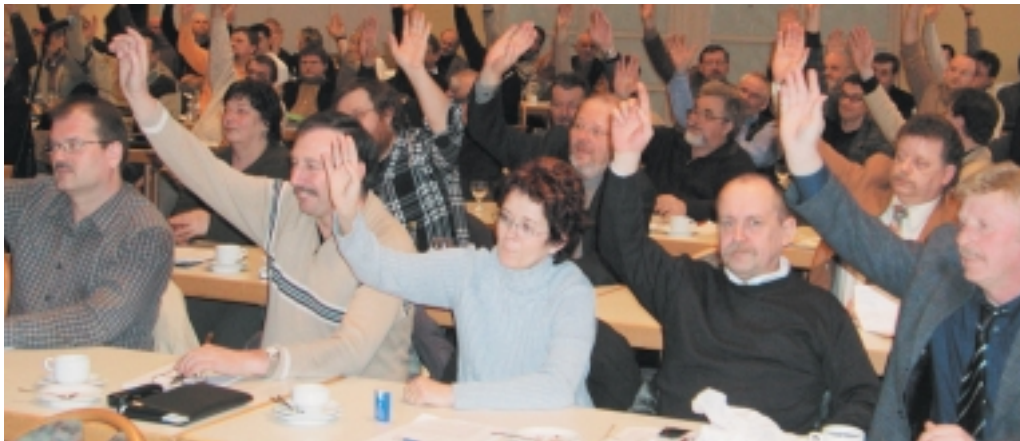
Grünes Licht von der Tarifkommission: Der Abschluss gilt