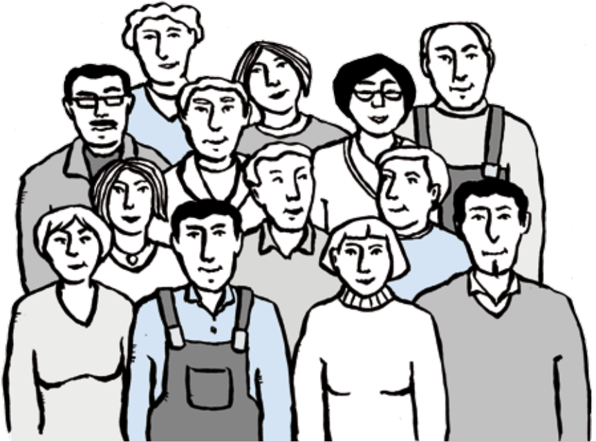
Illustration: Vera Brüggemann