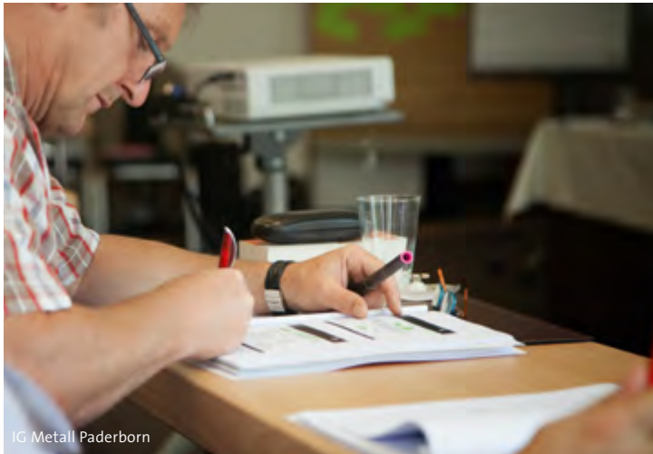
IG Metall Paderborn

Die Tagung richtet sich insbesondere an die Betriebsratsvorsitzenden und ihre Stellvertretungen. Abhängig vom Thema liegt die inhaltliche Gestaltung der Einzeltermine bei externen Fachleuten, z.B. Arbeitsrechtsanwälten, oder bei sachkundigen gewerkschaftlichen Fachleuten. Sie liefern in komprimierter Form einen Überblick zum Stand der Dinge und erläutern die aktuelle Rechtsprechung zum jeweiligen Thema. Ständiger Tagesordnungspunkt ist die Information über aktuelle Themen der Betriebsratsarbeit vor Ort. Der gegenseitige Austausch wird zu einer hilfreichen Unterstützung bei der laufenden Betriebsratsarbeit.