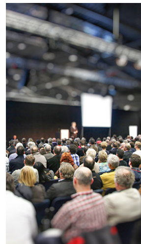
IG Metall Vorstand