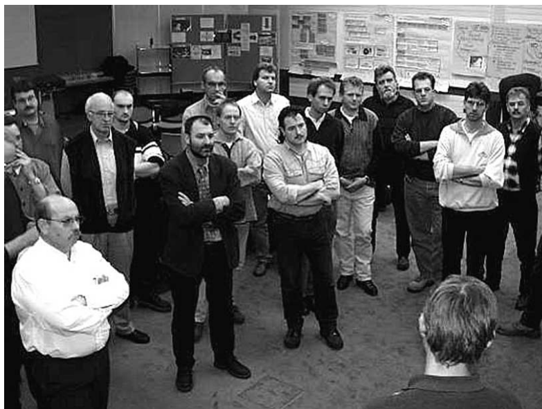
Mitglieder des Netzwerkes INTAG im Seminar