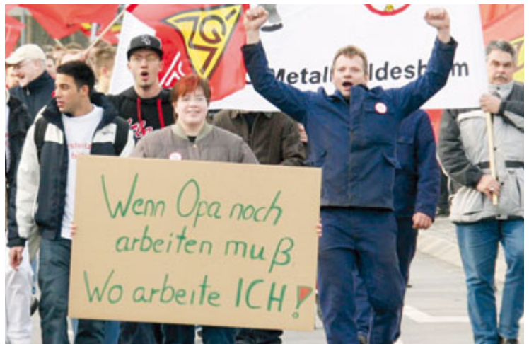
Die IG Metall mobilisiert: Keiner kann bis 63 oder 67 die Belastungen durchhalten. Deshalb brauchen wir eine neue Altersteilzeit.

Deshalb wird die Bundesregierung nur dann reagieren, wenn Arbeitgeber und IG Metall sie unter Zugzwang setzen. Mit der Kündigung der Tarifverträge endet am 4. Juni die Friedenspflicht. Dann kann die IG Metall eine neue Regelung erstreiten.