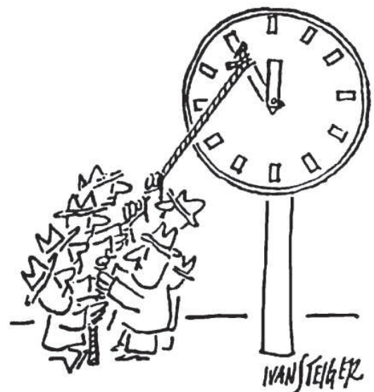
Zeichnung: Ivan Steiger aus FAZ v. 7.9.1982, S10

Informationen für Karmann-Beschäftigte, Interessierte und Unterstützer auf www.arbeit-fuer-karmann.de (Pressespiegel Karmann/Automobilindustrie, Publikationen, Links zu interessanten Internetseiten, Fotos von Aktionen, Buchtipps, etc.)