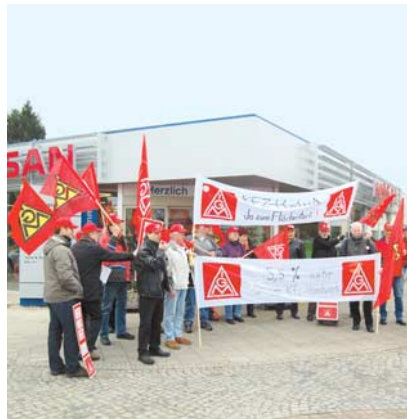
Protest in Delmenhorst