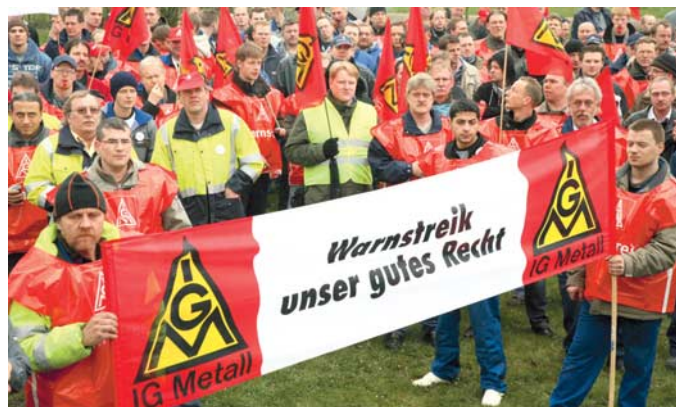
Ohne Druck kein Ruck – Warnstreiks führten zum Erfolg.

Ohne Ergebnis blieben die Verhandlungen mit den Innungen Niedersachsen-Mitte und Osnabrück (siehe Rückseite).