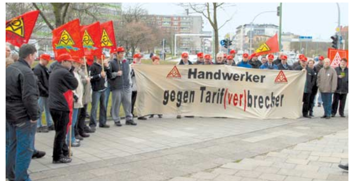
Protestaktion in Bremerhaven