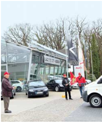
Kundeninfo in Delmenhorst