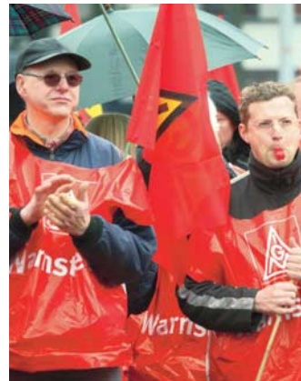
»Autokorso« in Hannover mit anschließender Demonstration