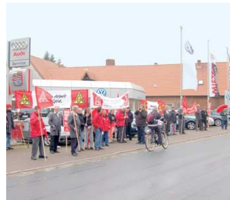
Warnstreik in Nienburg