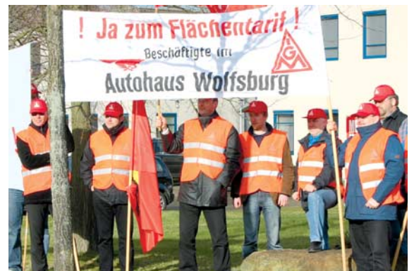
Protest in Großburgwedel