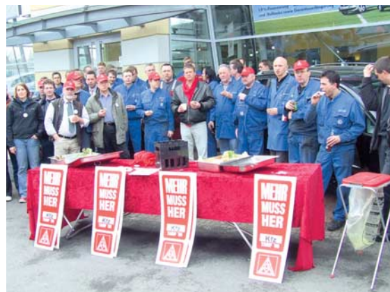
»Kfz-Imbiss« in Göttingen