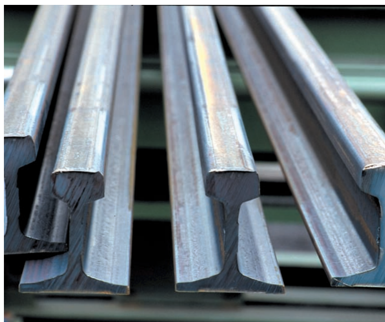
Stahl boomt: volle Auftragsbücher, hohe Gewinnerwartungen