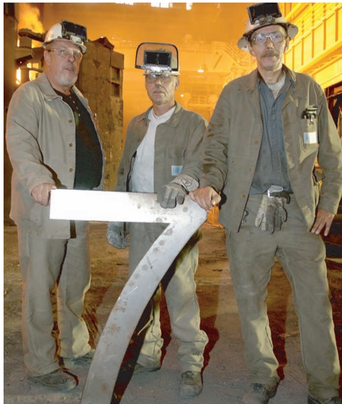
Im Stahlwerk der Hüttenwerke Krupp Mannesmann (HKM), Duisburg: Arbeiter präsentieren die Tarifforderung, eine stählerne Sieben

Die Arbeitgeber räumten ein, dass es der Stahlindustrie sehr gut geht. Aber das sei eine Ausnahmesituation. Und die Zukunft stecke voller Risiken. Jede Tarifierhöhung zwingt die Unternehmen zu Personalabbau. Das Motto müsse deshalb lauten: „Maß halten.“