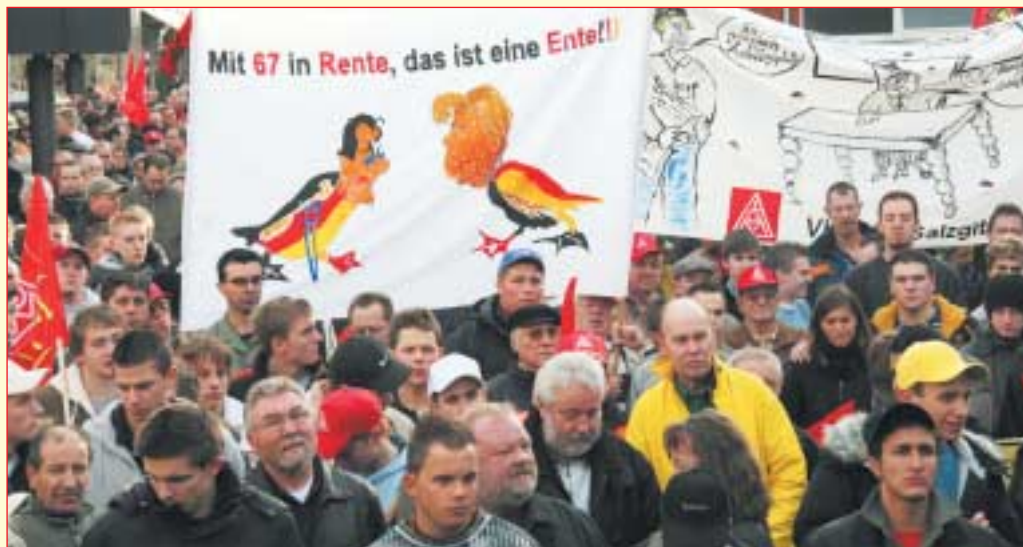
Innenstadt von Salzgitter-Lebensstedt am 6. Dezember: Über 4000 legten die Arbeit nieder

Damit war Salzgitter bundesweit Vorreiter. In den Wochen bis Weihnachten liefen auch anderswo vielfältige Aktionen