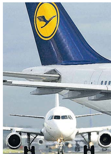
Die Lufthansa will die Kosten im Passagiergeschäft deutlich senken.