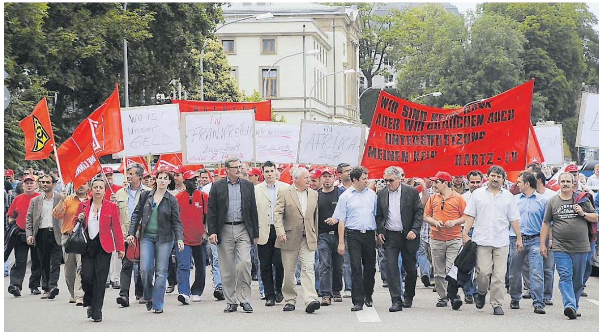
Die Demonstranten marschierten gestern durch die Innenstadt zum Wirtschaftsministerium.